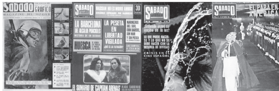
Algunes portades històriques del setmanari.